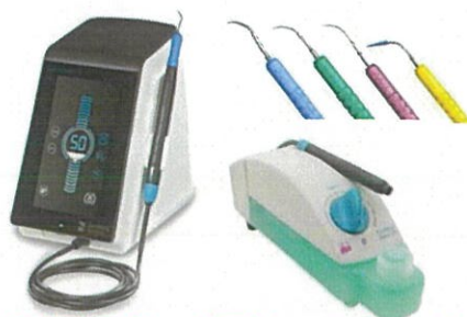
患者様 術者様にも優しいスケーリング